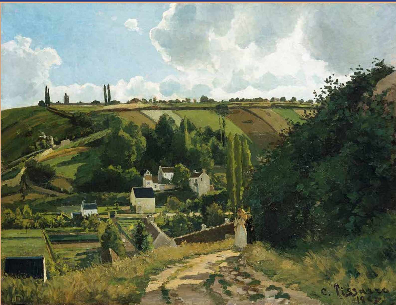
„Wzgórze Jalais, Pontoise” – Camille Pissarro

„letni pejzaż mucha zdobywa wzgórze w galerii sztuki”